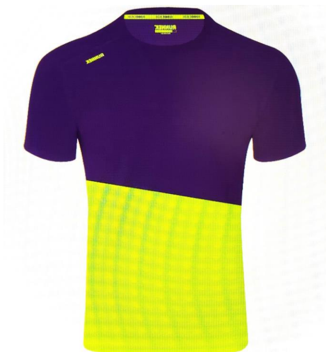
Camiseta colección desde la talla 4-6 a la XXL